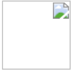
سید بهروز پرنوی