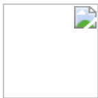
سید بهروز پرنوی