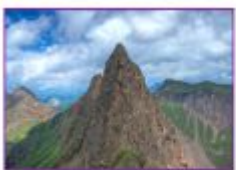
ب) کوه جوان

۷ شکل زیر مربوط به دو کوه است. مقدار فرسایش آنها را باهم مقایسه کنید.