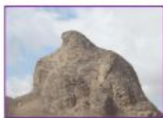
الف) کوه پیر

۸ عامل هر یک از رویدادهای زیر چیست و نوع هوازدگی کدام است؟